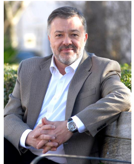
Darío Dolz Fernández Alcalde de Cuenca

Procede, por tanto, que entre todos y todas hagamos un esfuerzo adicional para proteger a la infancia y mitigar los efectos que esta pandemia pueda tener en las futuras generaciones.